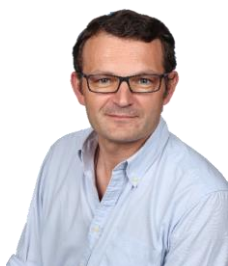
Chef d'Établissement coordinateur et Directeur du Collège Emmanuel Vilbois